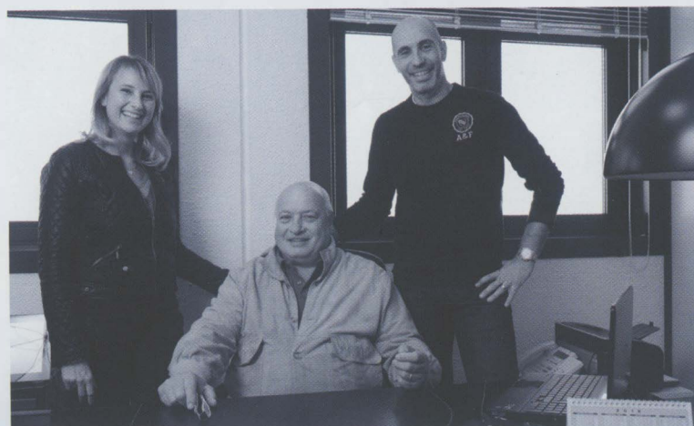
Il team della Cantini Lorano di Firenze www.cantinilorano.it

«La Cantini Lorano Srl vanta una presenza storica nel panorama industriale toscano riguardante i settori calzaturiero e pelletteria. L'enorme sviluppo del settore pelletteria nel comprensorio fiorentino, avvenuto a partire dai primi anni '90 e il concomitante declino del settore calzaturiero, ha indirizzato le scelte commerciali della ditta nella sua sempre maggiore specializzazione nella fornitura di materiali di rinforzo per borse a tutte le firme più importanti presenti nel territorio. Pelletteria e calzaturiero sono, senza dubbio, due ambiti che hanno contribuito a diffondere il made in Italy nel mondo. Una peculiarità che, nonostante le problematiche connesse all'attuale situazione economica e alla concorrenza proveniente da paesi come India e Cina, è in grado di fare la differenza. L'italianità continua a essere portatrice di un importantissimo valore aggiunto sul mercato, in quanto è sinonimo di qualità, in-